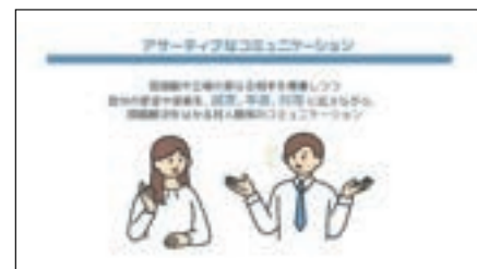
ハラスメントを防ぐ! 職場のコミュニケーション講座